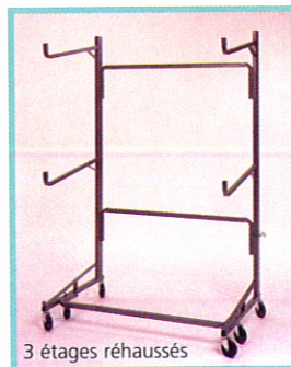
3 étages réhaussés